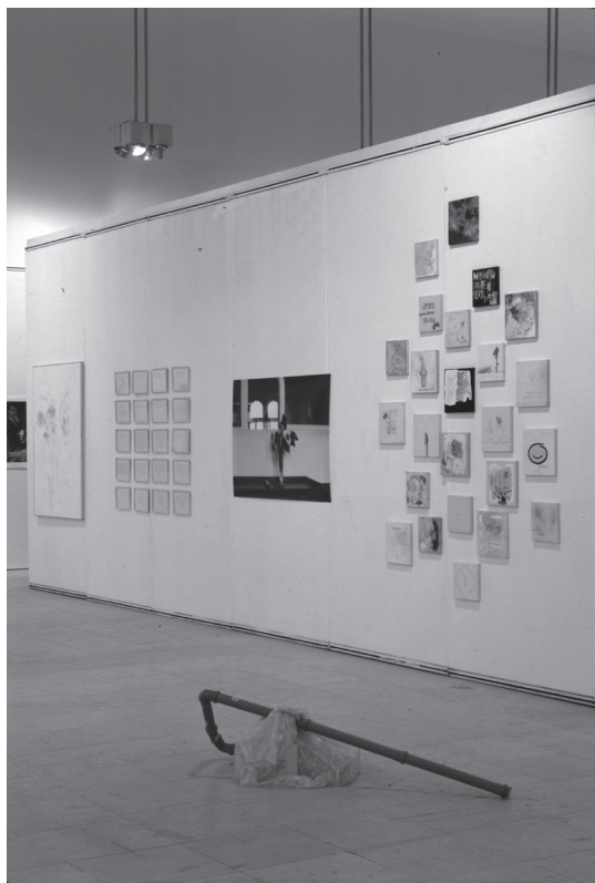
Snižovaný rozpočet , kurátoři Jana a Jiří Ševčíkovi, Praha: Výstavní síň Mánes, 1997–1998, pohled do expozice, foto: archiv Jiřího Ševčíka