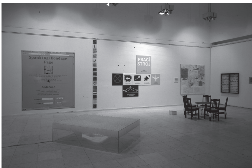
Snižovaný rozpočet , kurátoři Jana a Jiří Ševčíkovi, Praha: Výstavní síň Mánes, 1997–1998, pohled do expozice, foto: archiv Jiřího Ševčíka