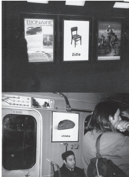
Tomáš POLCAR, Reklama , projekt prezentovaný na výstavě Umělecké dílo ve veřejném prostoru , kurátor Ludvík Hlaváček, Praha: Národní galerie 1997, světelné skříně, billboardy a reklama ve vagoncích metra a na jiných místech Prahy