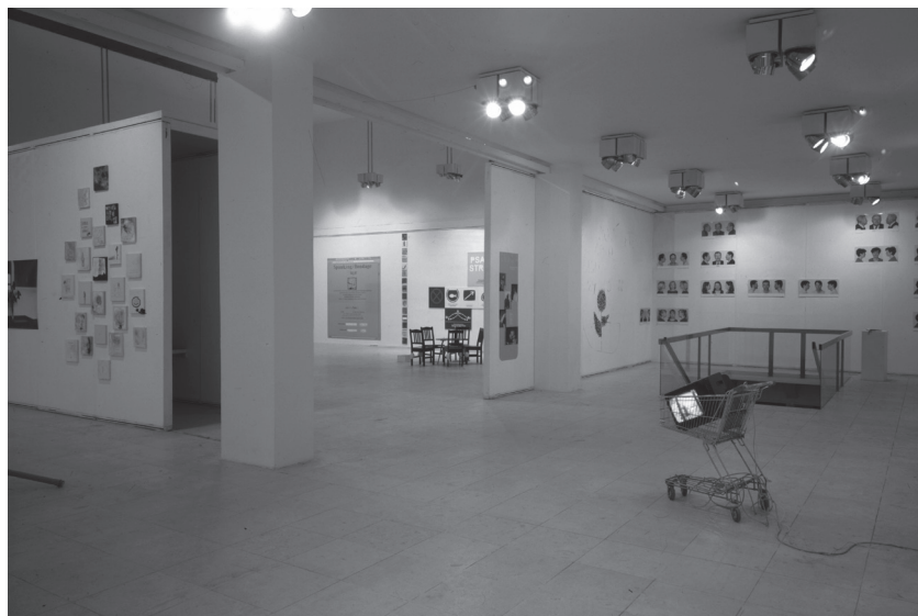
Snižovaný rozpočet , kurátoři Jana a Jiří Ševčíkovi, Praha: Výstavní síň Mánes, 1997–1998, pohled do expozice