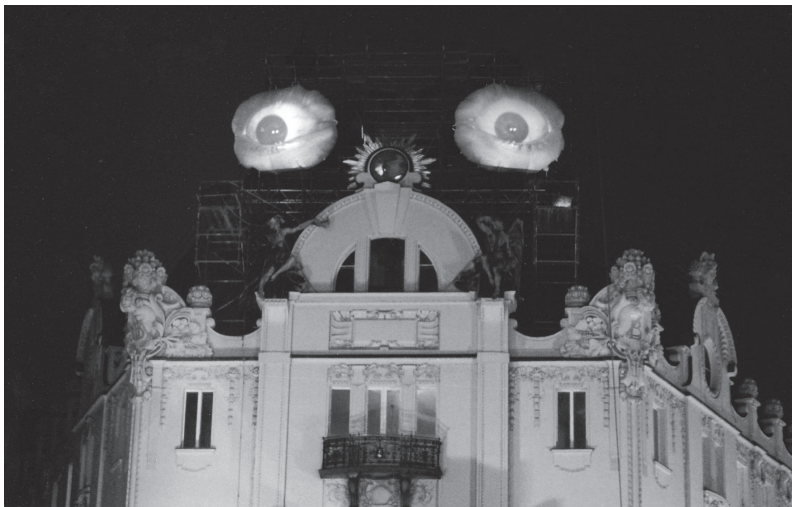
Tomáš KOTÍK, Perception machine II , 2000, projekt vytvořený v návaznosti na výstavu Umělecké dílo ve veřejném prostoru , ocelové vahadlo umístěné po dobu tří měsíců na náměstí při pražské Sněmovně, foto: archiv CSU Praha