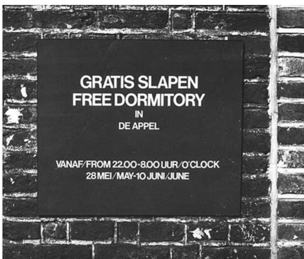
Jan Mlčoch, Noclehárna / Free Dormitory , De Appel, Amsterdam, 1980

Obálka katalogu výstavy / Cover catalogue Works and Words , De Appel, Amsterdam, 1979