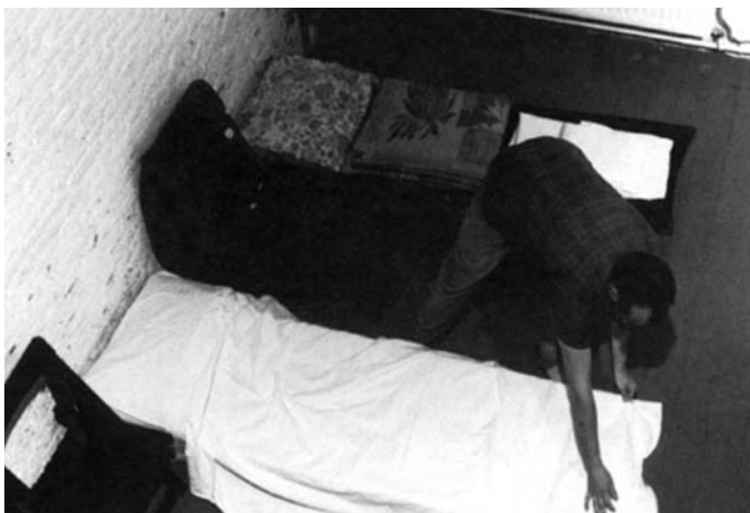
Jan Mlčoch, Noclehárna / Free Dormitory, De Appel, Amsterdam, 1980