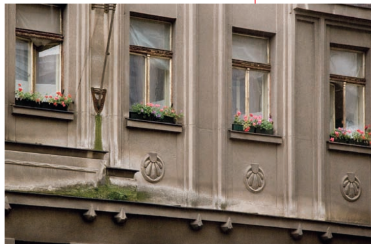
Květinová výzdoba za okna. Projekt pro výstavu Indikace festival 4+4+4 dny v pohybu, Praha, 2006.