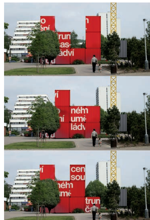
Soutěžní návrh Hynka Alta a Alexandry Vajd. Foto: archiv skupiny Ládví

Soutěžní návrh architektonického studia MOBA. Foto: archiv skupiny Ládví