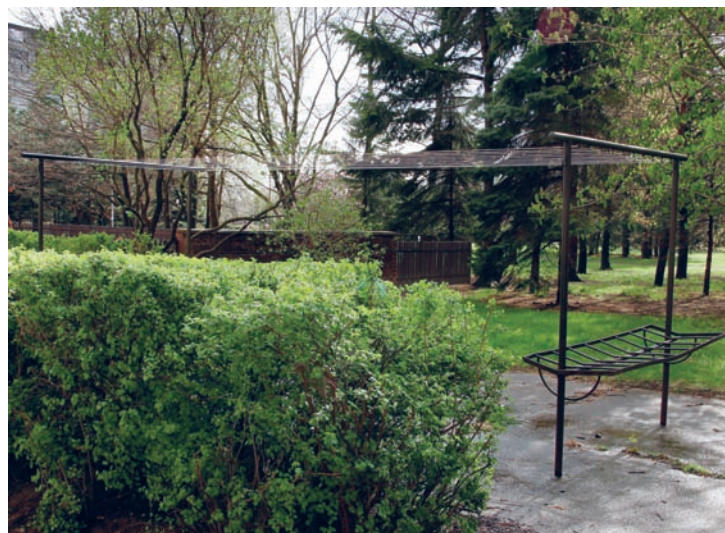
Obnovení venkovních sušáren. Natažení nových šňůr do veřejných sušáren – za 14 dní zničeno, Praha-Ládví, Sídlíště Ďáblice, březen 2006.

JT: Pro mě byl šok, když jeden úředník z radnice hodně pejorativně říkal: „Ááá, vy jste ti zastánci socia-