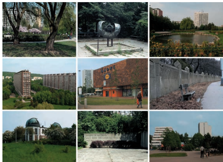
Pohledy Ládvi. Autorské pohledy, umístěné do prodejny s denním tiskem, Praha-Ládvi, sídliště Ďáblice, 2006.