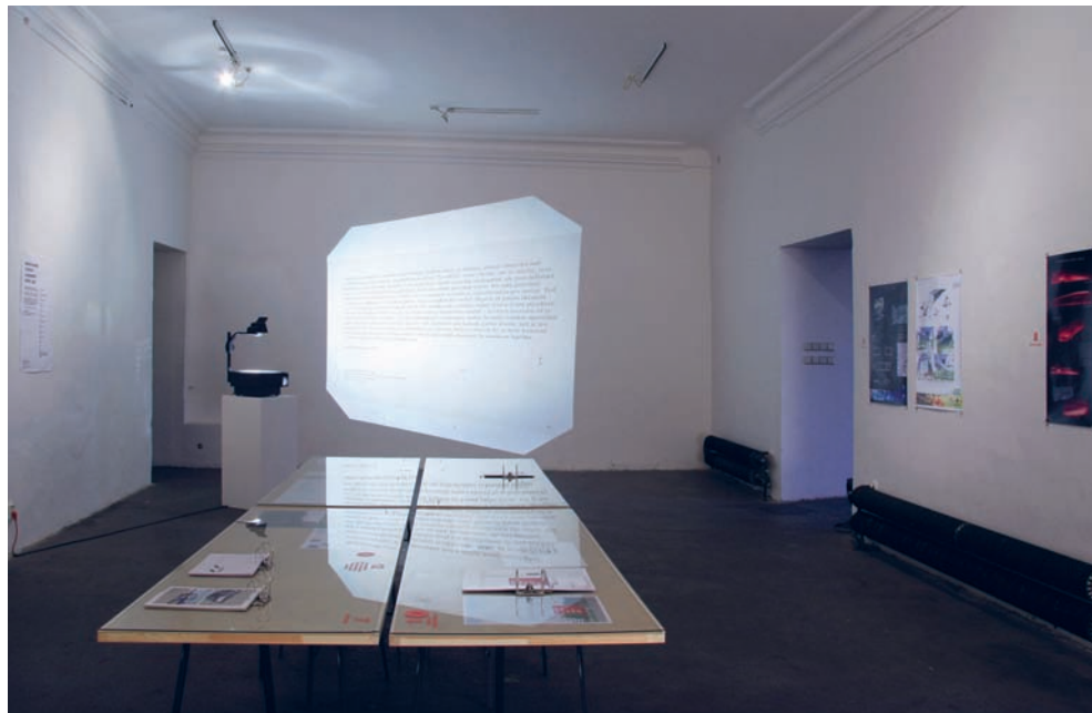
Pohled do výstavy ideové architektonické soutěže na CSU Ládví, Galerie NoD/Roxy, 2009.

a http://vvp.avu.cz/idatum/search/autori-228