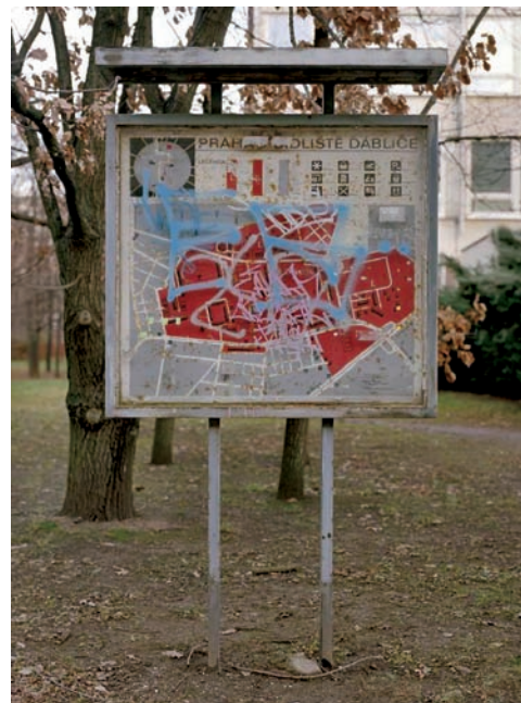
Oprava vitríny s plánem sídliště. Natření vitríny, vsazení nového skla, Praha-Ládvi, sídliště Ďáblice, 2006.

Vyhlášením ideové soutěže jste chtěli zahájit diskusi mezi umělci a architektky. Podařilo se vám to?