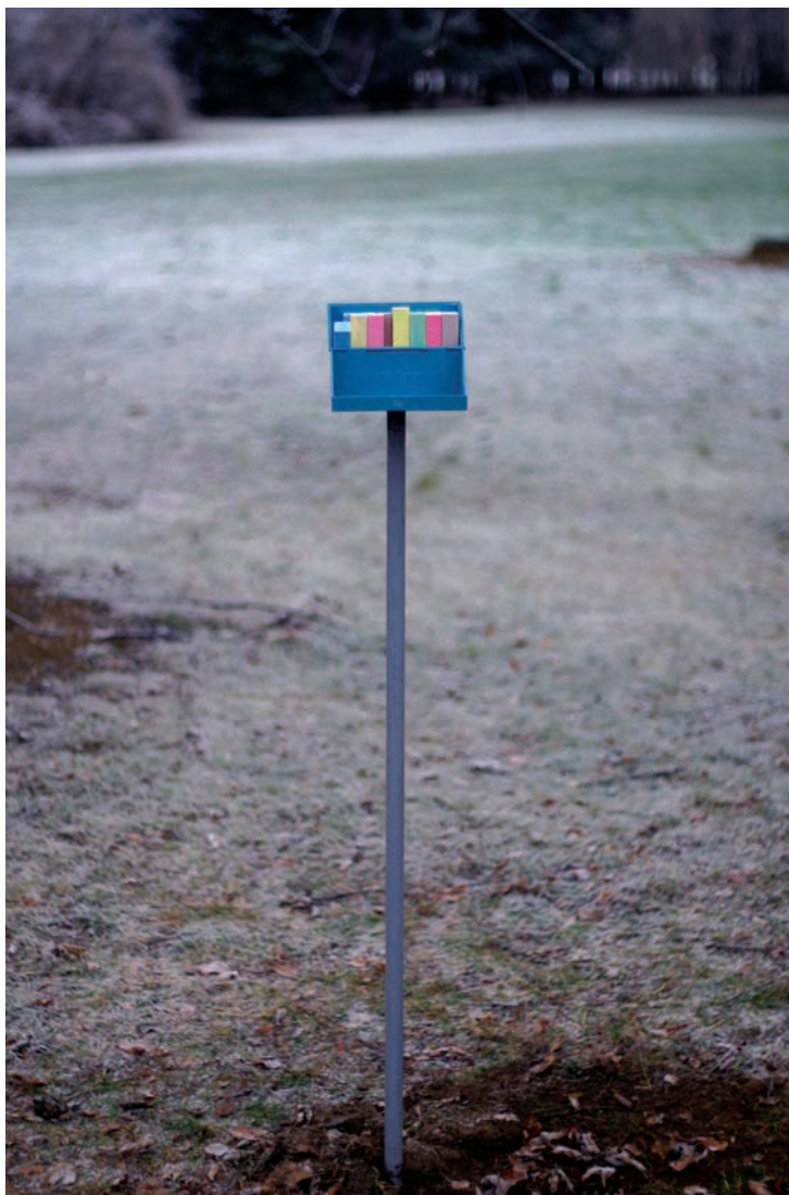
Stojan na křídý. Křídý umístěné na dětské hřiště, Praha-Ládví, sídliště Ďáblice, 2006.