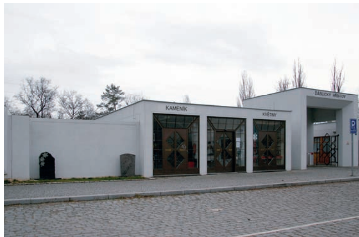
Žádost o odstranění poutače ze zdi Ďáblického hřbitova – na základě emailové korespondence byl poutač odstraněn, Praha – Ďáblice, 2006.