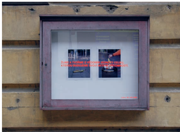
Vitrína BZJ. 2 fotografie, text, Praha-Holešovice, září 2005.

AS: Očividně veze do sběru plastiku někdo, kdo ji neměl na dvorku a oni ji přijmou. Necítíme vinu za to, že reliéf ukradli. To je problém doby.