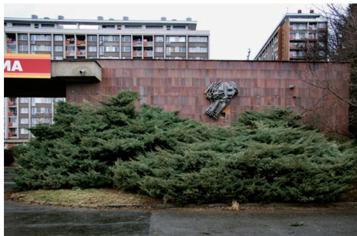
Prostřihání keřů. Prostřihání keřů za účelem znovuoobnovení pohledu na kovový reliéf Praha-Ládví, sídliště Ďáblice, 2005.

AS: Já myslím, že to vyplývá postupně. Člověk kolikrát začne dělat věci a nedohlédne důsledky. Zpětně je hodnotit v širším kontextu. Politika v tom ze začátku