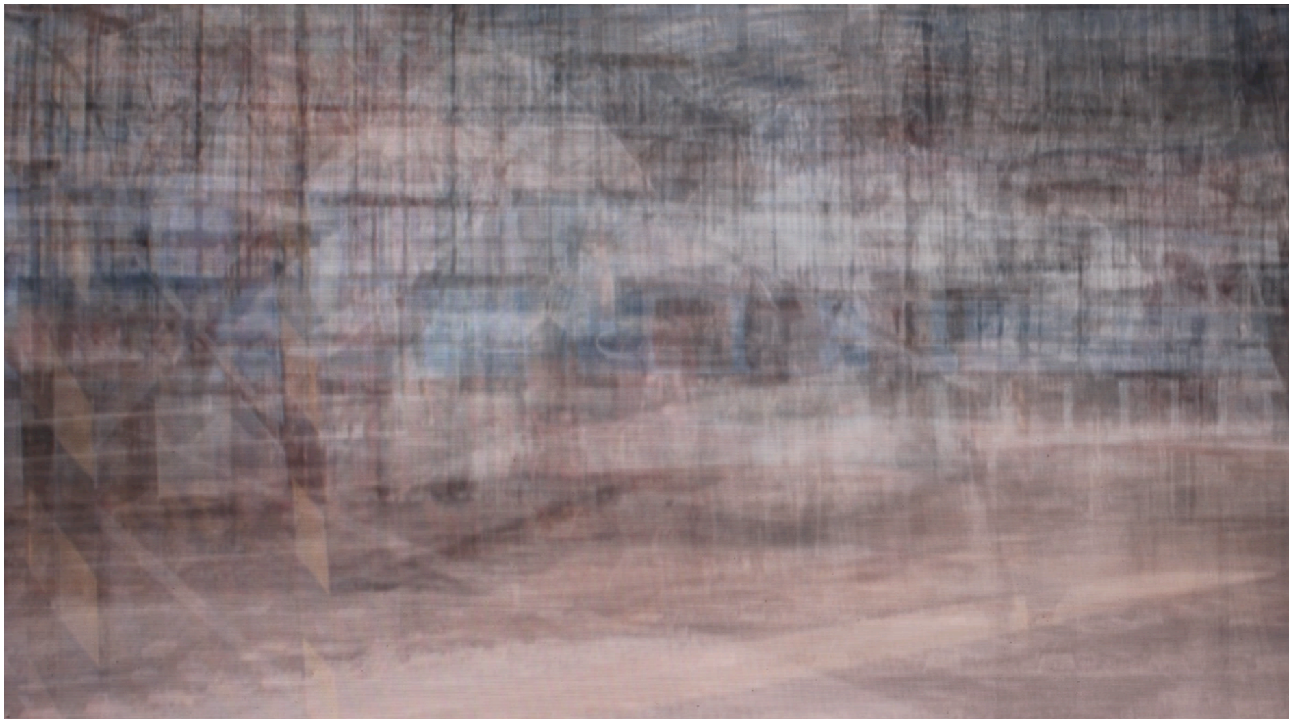
Vlak, animace, smyčka 00:00:52