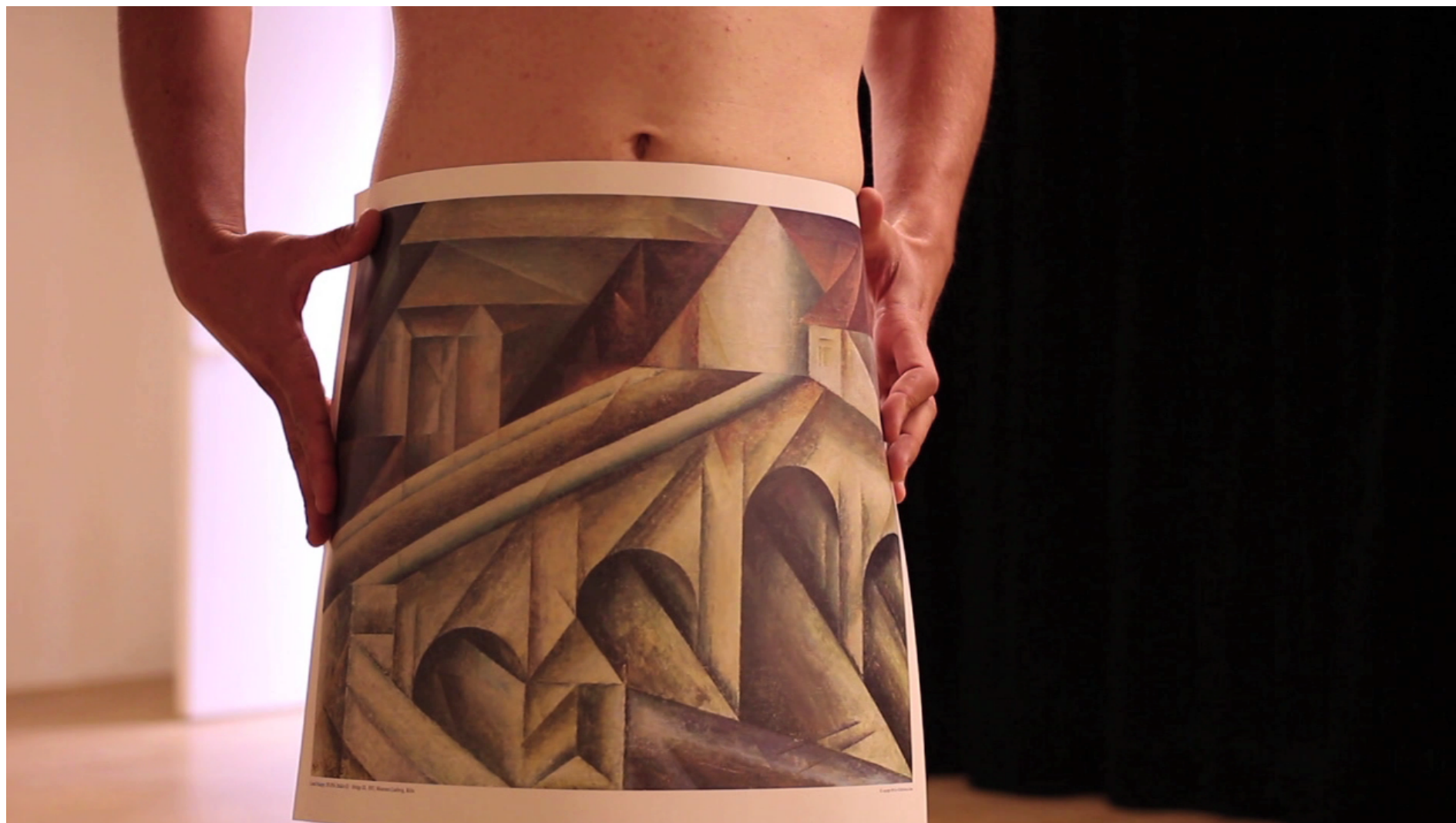
Molo, HD video, zvuk, 00:04:09